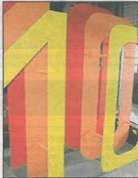
Un grand panneau représentant le 10 a été conçu.

Trois jours où la population de Comines double, rassemblant près de 20 000 fidèles ou amateurs : « Je crois que ce moment permet à des familles de se rassembler, explique Denis Lambin, membre du comité. On vient pour le spectacle, mais aussi pour la folie, car il faut être un peu fou pour lancer des louches en bois ! » Pour cette année, les