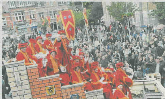
Réussirez-vous attraper au vol l'une des nombreuses louches jetées durant le cortège ou des fenêtres de l'hôtel de ville ?

► 4. Un esprit de fête. Durant trois jours, la ville se pare de ses plus beaux atours pour faire la fête. Aux origines, le cortège avait lieu le lundi et tous les Cominois avaient un jour de congés ce jour-là. Le cortège, par ses costu-