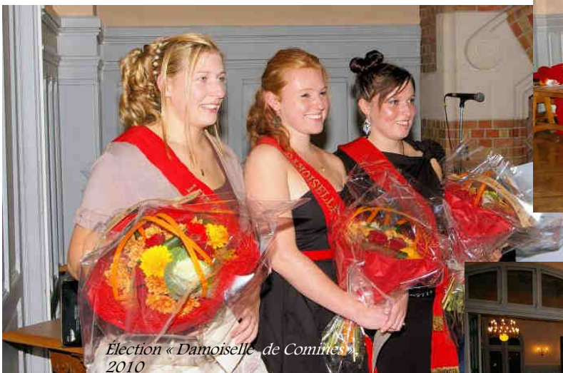
Élection « Damoselle de Comines » 2010

A 19 h 30, dans les salons d'honneur de l'Hôtel de Ville