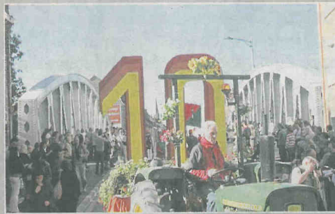
Amélie, la Damoiselle et ses dauphines ont paradé dans la louche géante, avant d'en jeter des fenêtres de l'hôtel de ville. Le char du 10, franchit le trait d'union entre les deux Comines, le pont frontière. La joie de ces deux jeunes filles qui ont su sa faire une petite place dans la foule pour attraper des louches, gravées 10.10.10.